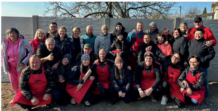
Den vepřových specialit v Dyji