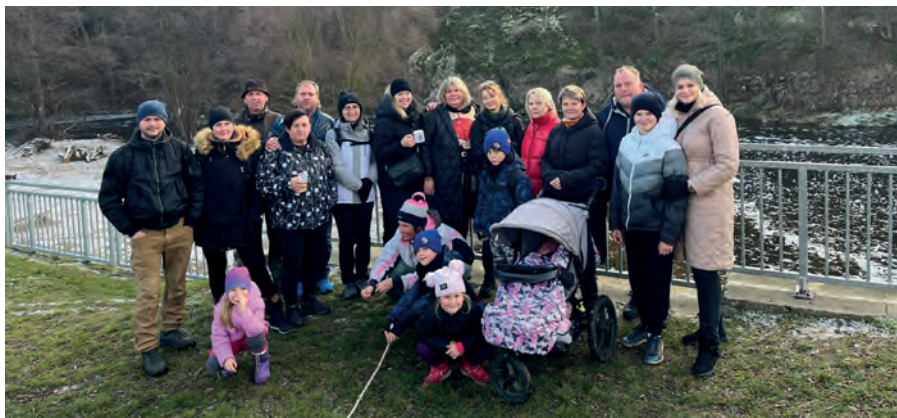
Vánoční procházka do Tasovic