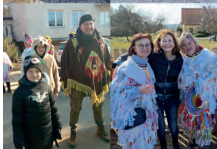
Střípky z masopustu