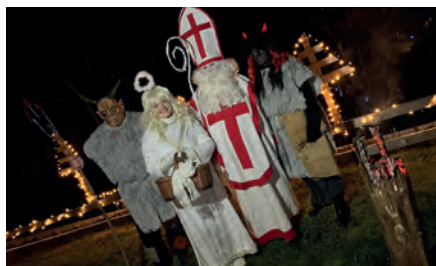
Mikuláš, čert a anděl chodil obcí