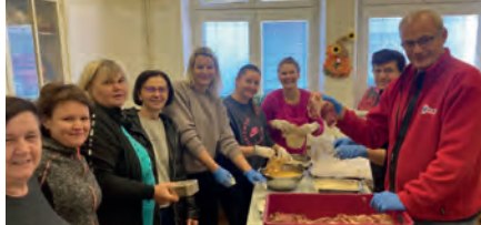
Den vepřových specialit