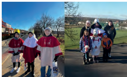
Na Tři krále v Dyji