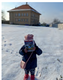
Reklama na zpravodaj