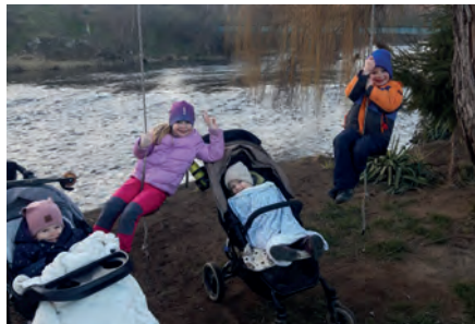
Ze života na vesnici